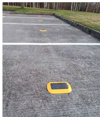
Sensoren auf den Parkflächen erkennen, ob der Platz belegt ist.

Es wird vom Bundesministerium für Digitales und Verkehr (BMDV) im Rahmen