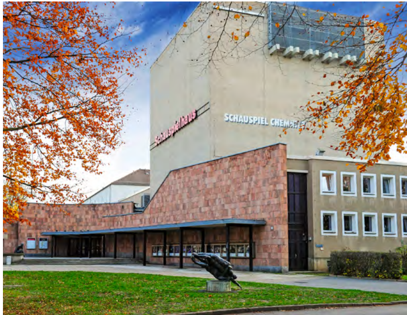
Die Sanierung des Schauspielhauses wird deutlich teurer als zunächst angenommen. Deshalb muss das Vorhaben neu bewertet werden.