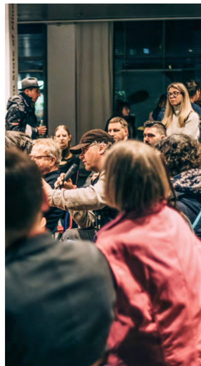
Austausch in entspannter Atmosphäre in der Schmidtbank-Passage.

Beim Info-Café am 12. März berichten die Kolleginnen und Kollegen von Chemnitz 2025 unter anderem über Möglichkeiten der Beteiligung am Projekt #3000 Garagen. Das Team Generation informiert über den Start eines Tanzworkshops für ältere Menschen sowie Angebote für 14- bis 19-Jährige, die eigene Ideen umsetzen möchten. Im April gibt es im Rahmen des Projekts »Gelebte Nachbarschaft« eine Aktionswoche mit Baumpflanzungen und umfangreichem Rahmenprogramm. Erste Details dazu gibt es ebenfalls beim Info-Café. Alle, die sich für das Freiwilligenprogramm interessieren, finden ebenfalls Ansprechpartnerinnen und Ansprechpartner für ihre Fragen.